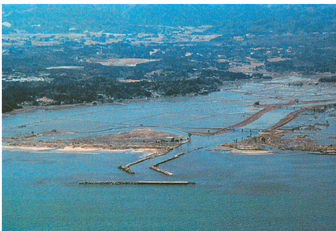
真野川漁港の様子