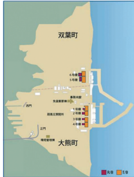
■ 主要施設の配置図