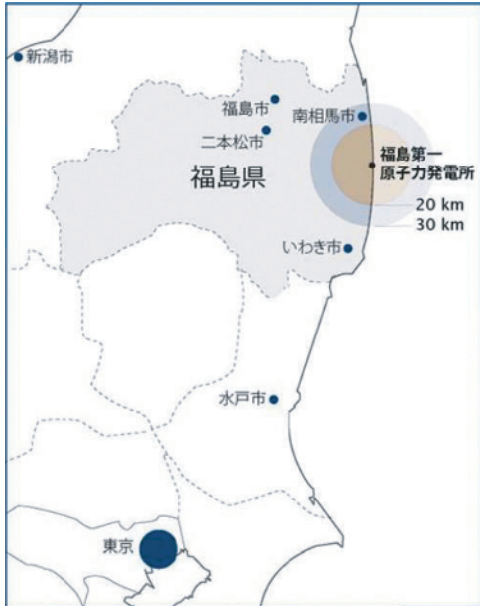
■ 福島第一原発の位置図

福島第一原発は、東京の北北東約 220km、福島県の太平洋岸のほぼ中央に位置し、同県双葉郡の大熊町と双葉町にまたがっている。敷地面積は約 350 万 m 2 である。