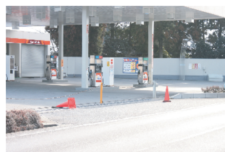
ガソリンスタンドは閉店 (3月13日撮影、原町区長野)

また、一般市民向けの給油の際には、給油できる店舗を防災無線や携帯電話での防災メールで周知をした。しかし、安定した燃料の供給ができない状況であったため、給油の際には、ガソリンスタンドに長蛇の列が生じた。これには、原発の状況が非常に不安定であったことが背景にある。また、ガソリンスタンドの従業員が避難して少ない中、その際の混乱を避けるために、南相馬市における給油券の発行や、市職員による給油行列の整理等の対応が施された。