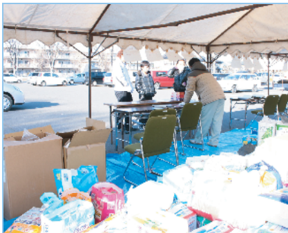
物資受付 (3月12日 保健センター駐車場)

また、全国から物資を搬入した個人も多数いたものの、避難所における避難者への供給を均等に配分することは、困難な状況であった。