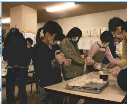
避難所へのおにぎりを握る (3月13日 南相馬市役所)