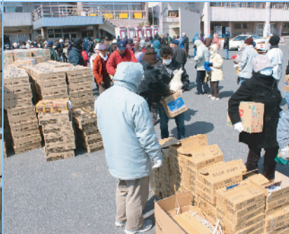
食糧配給 (3月26日 まごころセンター)