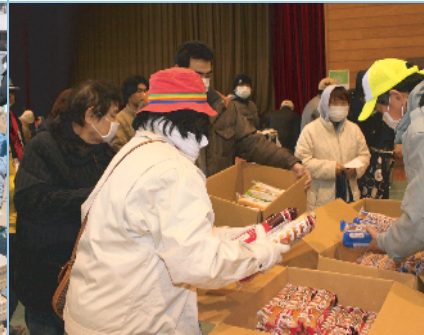
食糧配給 (3月26日 原三小)