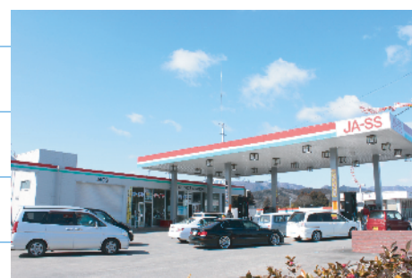
ガソリンスタンド行列（石神）