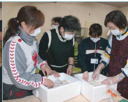
個数を数えて箱詰め (3月13日 南相馬市役所)