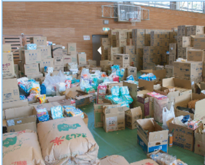
救援物資 (3月16日 小川町体育館)