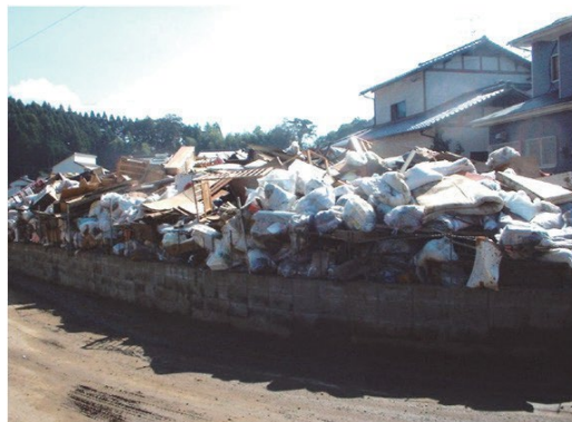
平成 17 年 9 月台風 14 号勝手集積所の発生

特に大きな被害を受けた平成 17 年 9 月の台風 14 号では、市内のいたるところに勝手集積所が発生し、片付けごみが混合状態で山積みとなったため、収集に時間がかかり、復旧への影響が生じました。このことを教訓に、延岡市は、平成 18 年度から、災害ごみの地区集積所となる災害用臨時ごみステーションの選定を開始しました。