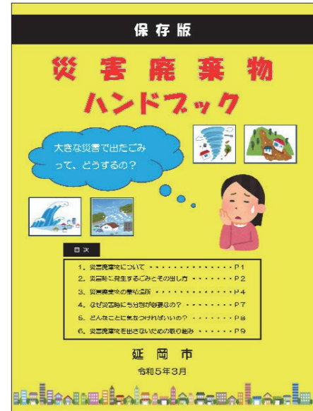
住民向け災害廃棄物ハンドブックの作成・配布