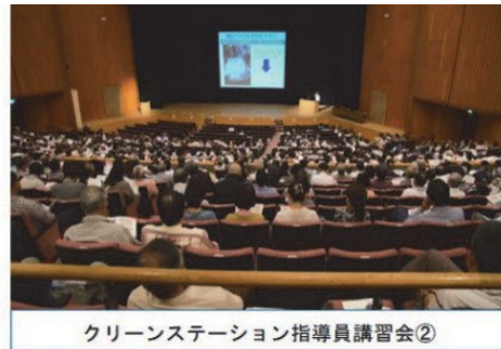
クリーンステーション指導員講習会②