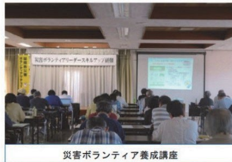
災害ボランティア養成講座