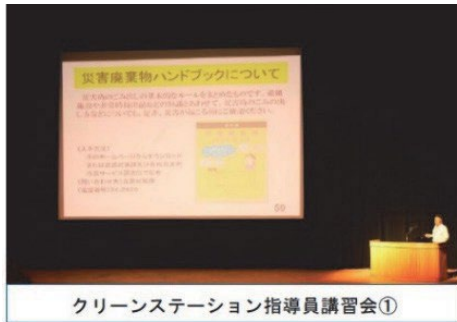
クリーンステーション指導員講習会①