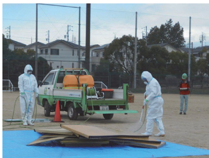
畳の消毒訓練の様子

仮置場運営訓練では、本物の不用品（訓練を実施した地区で出た不用品）を災害廃棄物に見立て、地区の住民が軽トラックで搬入するといった訓練が実施されました。また、災害時の防疫活動についての説明や、畳の消毒訓練も実施されました。