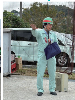
大根区公民館からほど近い大原公園での仮置場訓練