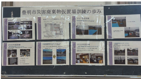
これまでの豊明市の災害廃棄物仮置場訓練の概要

市長から参加者に対して、災害への心がけとして、「日ごろから退蔵品の処分が大事」「命が大事」「家具の転倒防止」の3つのポイントが伝えられました。