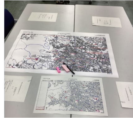
集積場、仮置場の位置を示した校区の地図

テーブルには、災害ごみの集積所、仮置場が示された校区の拡大地図が置かれており、これを利用し意見交換が行われました。